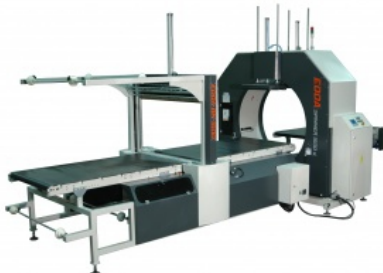
Упаковочный станок в стрейч пленку EDDA SPINNER 1000 S BN