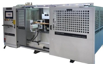
Токарно-фрезерный центр с ЧПУ Dincmak Tormat-Joker