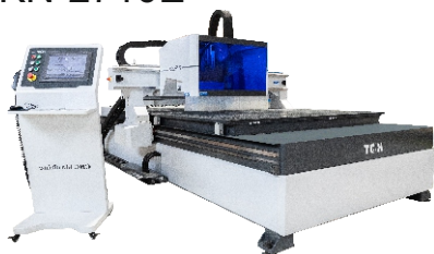
Обрабатывающий центр с ЧПУ KDT KN-2710E