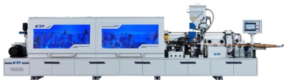
Автоматический кромкооблицовочный станок KDT KE-668JSA(45)