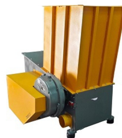
Станок для дробления отходов Timsan TMS 635