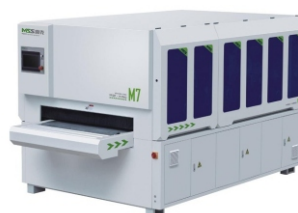
Рельефно-шлифовальный станок MSS KING 1300-M7