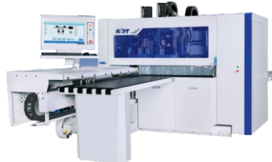
Сверлильно-присадочный станок с ЧПУ KD-612 MH